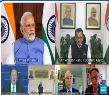
भारत के माननीय प्रधान मंत्री, श्री नरेंद्र मोदी द्वारा पर्यावरण के लिए जीवन शैली (LIFE) मूवमेंट का शुभारंभ